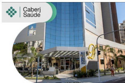
CABERJ SAÚDE CREDENCIA MAIS DUAS UNIDADES DA REDE D'OR

Os hospitais Rios D'Or e Niterói D'Or foram integrados à nossa rede de atendimento